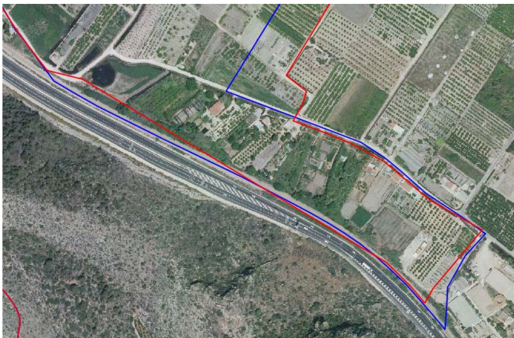
Figura 2. Límits de la ZEPA Montdúver - Marjal de la Safor (en blava) i del LIC Marjal de la Safor (en roig), interceptats pel traçat de la via a desdoblegar. Zona del Pla de les Fonts, immediatament al nord del Castell de Bairén, T.M. Gandia.

Aquest error en la informació dels apèndixs de l'EsIA es deu al fet que, com assenyala el propi text, s'ha redactat el document a partir de la cartografia d'hàbitats a escala 1:10.000 elaborada per la Conselleria competent en medi ambient de la Generalitat i quan no ha sigut possible a partir de la cartografia 1:50.000 elaborada a principis d'aquest segle pel MMA. La cartografia 1:10.000 està en l'actualitat en fase d'elaboració i de moment s'ha publicat només de forma molt fragmentària, de manera que no recull la cartografia d'hàbitats del LIC ES5233030 Marjal de la Safor. Per part seua, la cartografia 1:50.000 del MMA, no abasteix l'àmbit esmentat i deixa una zona sense cartografiar precisament en aquesta zona. Això no implica de cap manera que l'esmentat espai manque d'aquests hàbitats (de fet, va ser la presència d'hàbitats inclosos en l'Annex I de la Directiva d'Hàbitats la que va motivar la seua inclusió en el LIC).